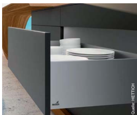
Perfektion leben: AvanTech

Geradlinig, puristisch und ohne Löcher oder Abdeckkappen in der Zarge präsentiert sich AvanTech in Aluminium.