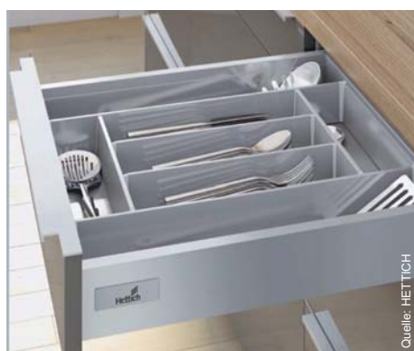
Kante mit Charakter: InnoTech Atira

Das neue System InnoTech Atira imponiert mit markantem Design. Auf Basis einer Zarge bietet es Ihnen vielfältige Möglichkeiten für Gestaltung und Funktionalität. Und garantiert damit hohe Wirtschaftlichkeit.