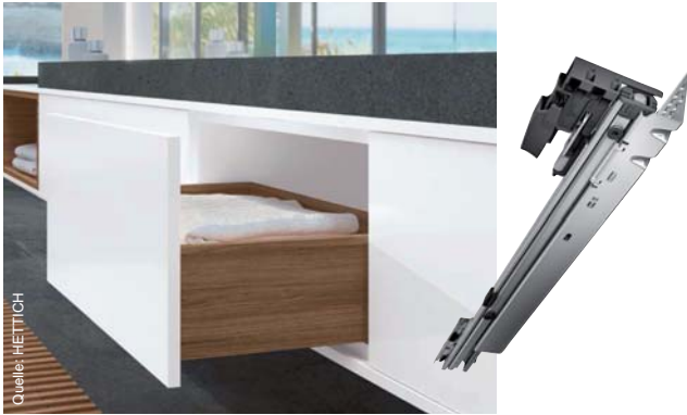
Begeisternde Präzision: Actro 5D