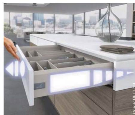
Öffnen, schließen, staunen: Push to open Silent

Ein leichter Druck auf die grifflose Front und schon öffnet sich der Schubkasten dank der innovativen, zweifach ausgezeichneten Mechanik – oder schließt sanft gedämpft.